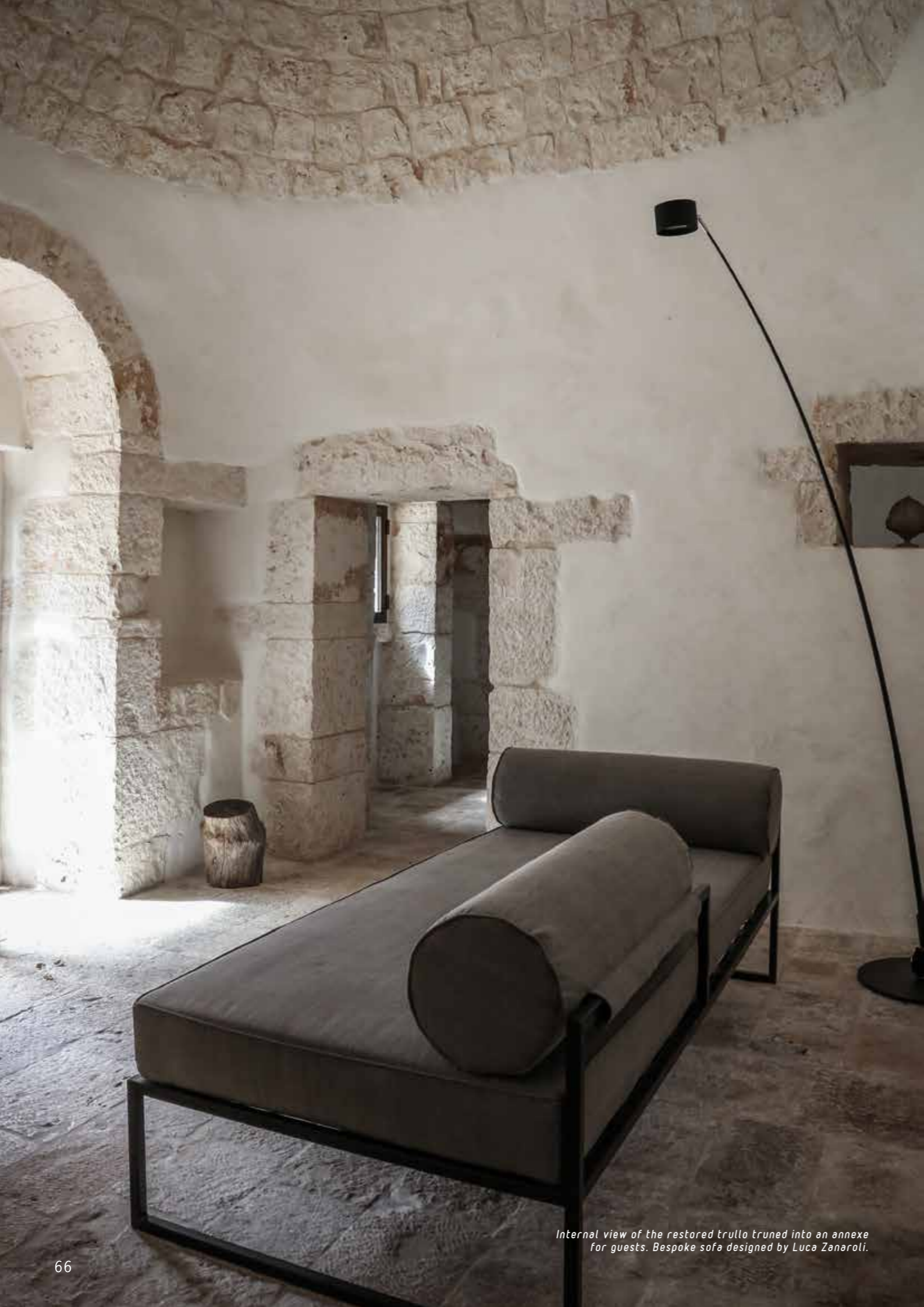
Internal view of the restored trullo truned into an annexe for guests. Bespoke sofa designed by Luca Zanaroli.