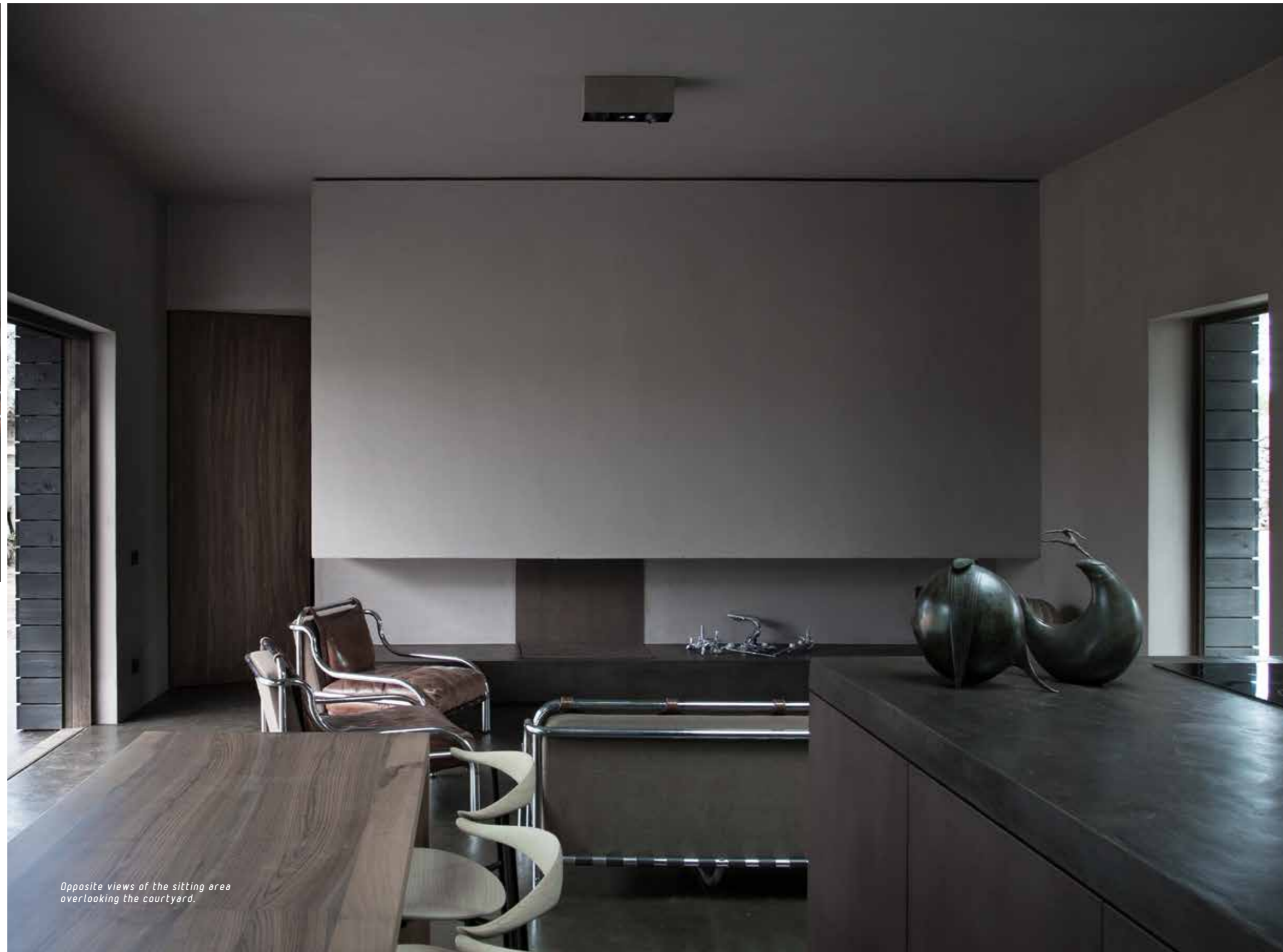
Opposite views of the sitting area overlooking the courtyard.

All the choices in terms of colours, materials and volumes have been made in such a way that everything appears harmonious and cohesive. A dialogue between the parts that is evident especially in the facade of the large central area, completely covered with black painted larch staves, which has both a thermal function of ventilated cavity wall to increase insulation, and a conceptual function of harmonious separation that, highlighting its diversity with other materials, creates a trait-d'union of great effect.