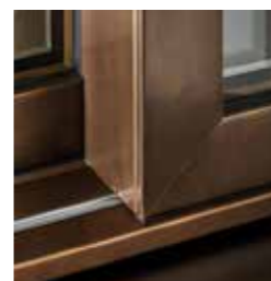
'EBE 85 AS' sliding door designed and produced by Secco Sistemi