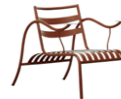
'THINKING MAN'S CHAIR' produced by Cappellini designed by J. Morrison