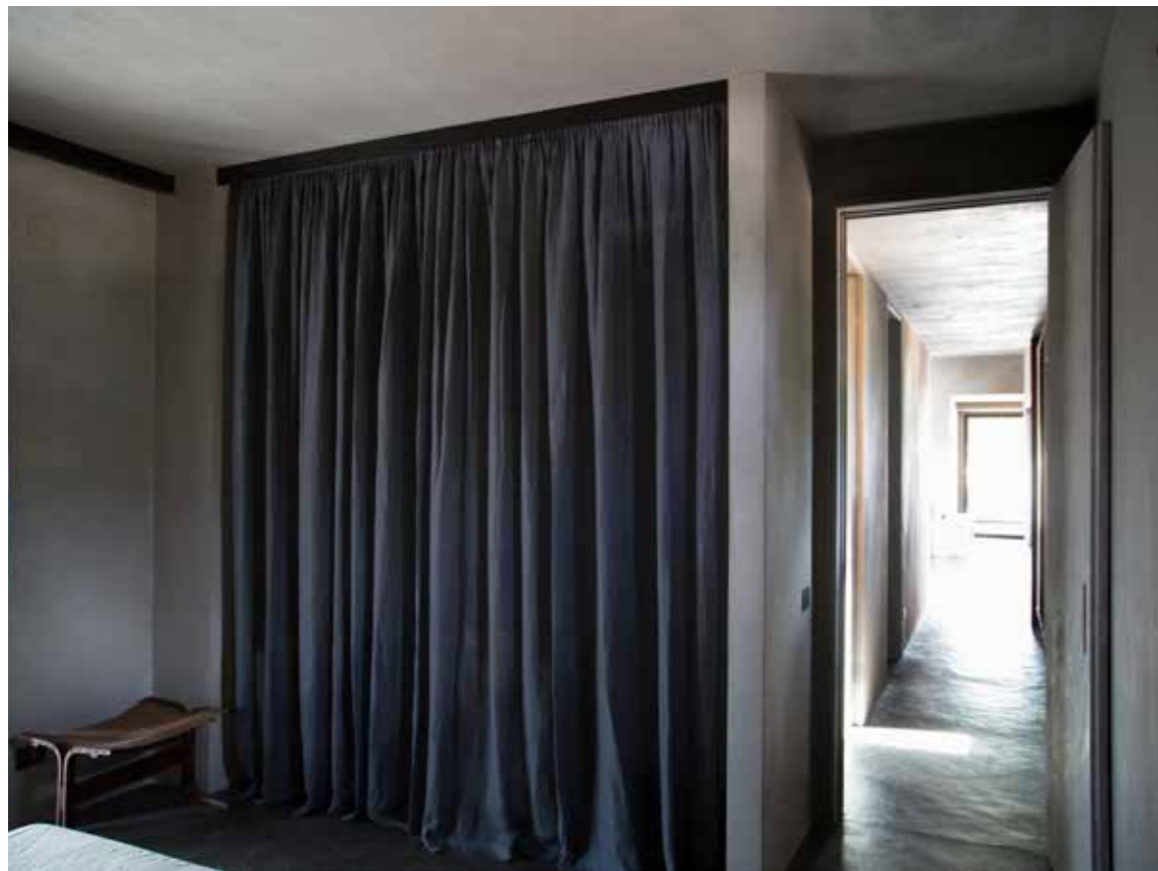
Detail of the master bedroom.

[IT] Con la sua inconfondibile struttura conica fatta di pietre sovrapposte, il trullo è sicuramente un'opera ingegneristica di tutto rispetto, ma anche una costruzione insolita dal carattere un po' misterioso.