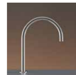
'FRE 91' swivelling spout produced and produced by Ceadesign